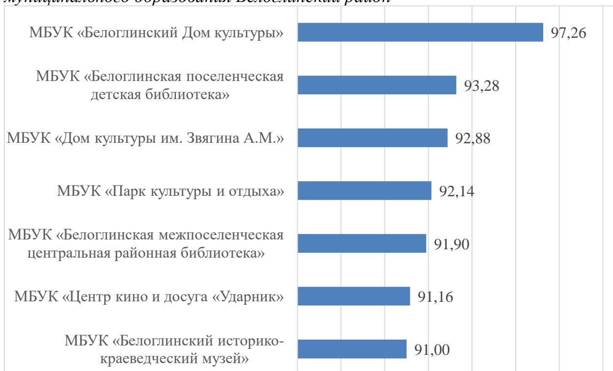
Гистограмма 1. Рейтинг по результатам сбора, обобщения и анализа информации о качестве условий оказания услуг организациями культуры муниципального образования Белоглинский район